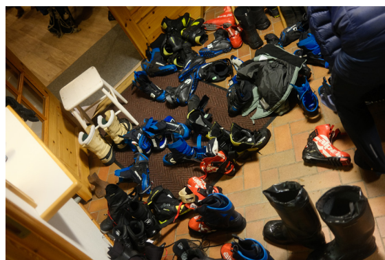
Klubbstugan är full av skidåkare.