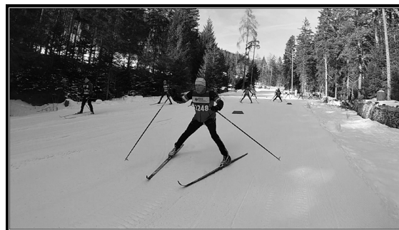
Stilstudie i backen.

Måndag: Buss till Venedig och flyg hemåt. Ytterligare en övernattnig vid Arlanda.