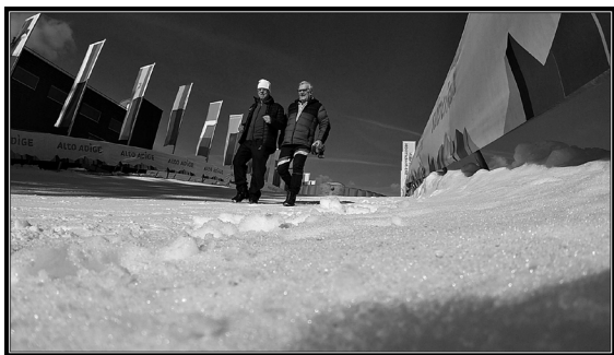
Servicepatrullen besöker målhusets tak.