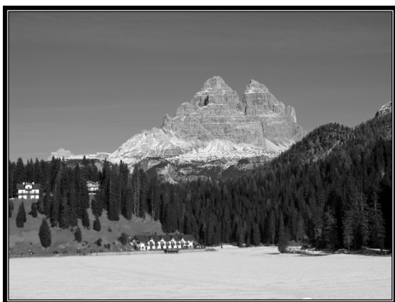
Fina vyer överallt i Dolomiterna.

Torsdag: Flyg via Amsterdam till Venedig för vidare busstransport två timmar till Cortina. Ankomst framåt kvällen till ett Cortina som var mitt i förberedelserna för OS. Inte mycket kvar av dagen mer än middag och en kvällspromenad i centrala delarna.