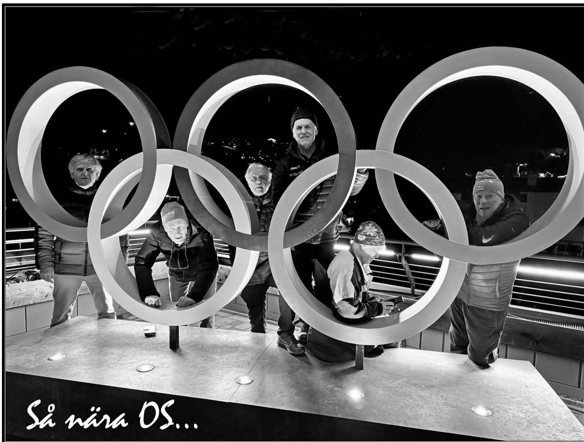
I väntan på OS.