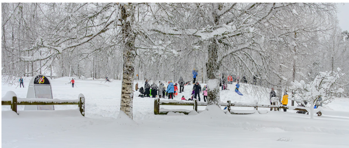
Skid- och pulkaåkning vid MSOK.