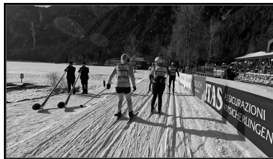
Från loppet.

Söndag: Vi var inte så intresserade av mer skidåkning utan det blev en lifttur till Europas högst belägna pizzeria, 2470 m över havet. Vädret slog om så det var bara dimma. Vid liftstationen halvvägs var det däremot bra sikt över hela dalen. Hela Cortina var en byggplats så vi undrade hur de skulle bli klara på de tre veckor som återstod till OS men så här efteråt så lyckades man ju bli klara till spelen.