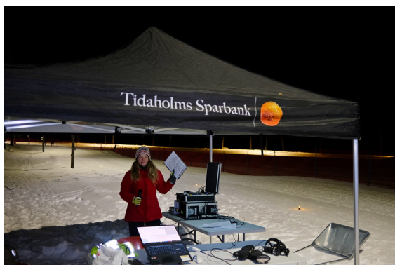
Stinas speakerpremiär.

Sparbanksloppet är en klassisk skidtävling med masstart. Den yngsta klassen är för de 0–8 år, de åker 0,8 km på gärdet. Damer och herrar 17 år och äldre åker längst, 10 km i form av tre varv med ganska tuffa backar. Min bror Erik var tävlingsledare och då Richard hade tackat nej till speakerjobbet denna gång så var visst tävlingsledarens lillasyster plan B för den rollen. Mina förberedelser inför kvällens funktionärsuppdrag bestod i att göra en spellista på Spotify, utöver speaker skulle jag ju också vara DJ.