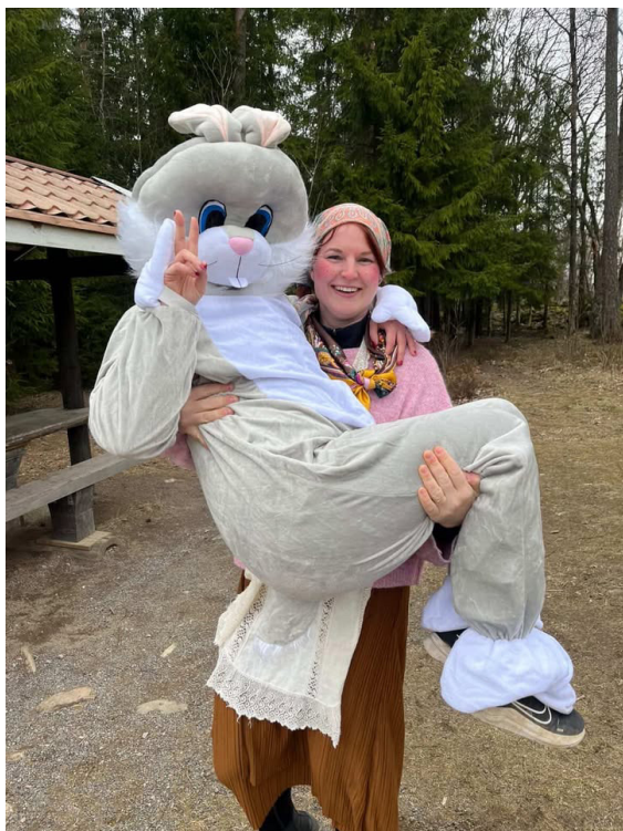
Den hårt slitande påskharen.

Detta är tredje året som äggorienteringen arrangeras och det är en mycket populär tillställning.