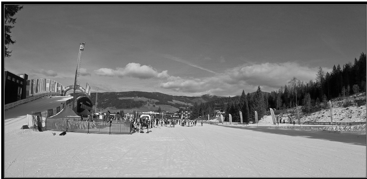
Skidstadion i Toblach.

Lördag: Samma väg till Toblach och väntan på start. I år hade vi en servicepatrull i form av Sören och Kjell som vi posterade ut i anslutning till backen. Fint väder, kall natt vilket gjorde att spåren och kylan höll i sig under loppet. Uppskattar antalet deltagare till cirka 500. Som tur är behövde vi bara köra halva backen som användes i Tour de Ski. Det räckte gott åt oss. Efter backen gick banan sakta uppför i 6–7 km till vändpunkt och därefter lätt nerför till varvning. Vid varvning skulle målhuset passeras. Backen över huset ser inte så mycket ut från sidan men den tog sin tid. En upplevelse i alla fall. Ett varv till på samma bana för att sedan gå i mål efter 26 km. Nöjda åker vi tillbaka till Cortina för att njuta av stan och vila trötta kroppar.