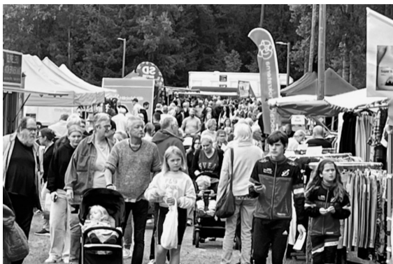
Knallar, besökare och MSOK:are.