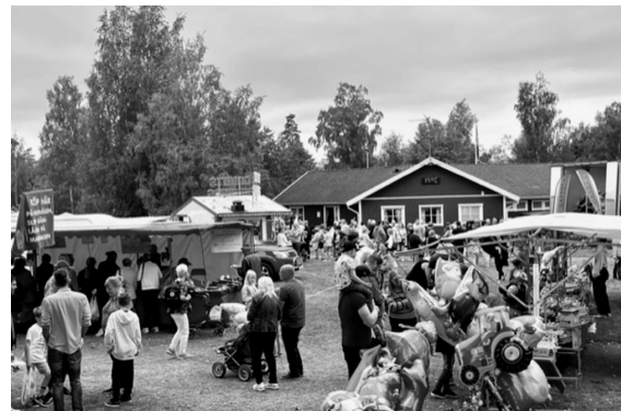
Mycket liv utanför MSOK-stugan.