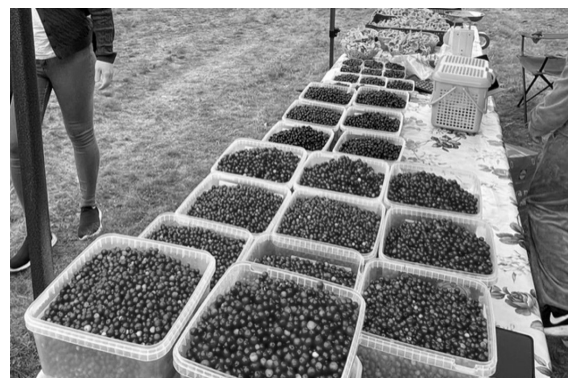
Lingon, blåbar och kantareller.