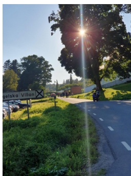
Vid Engelska villan.