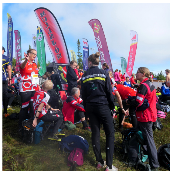
Klubbnsnack före start.