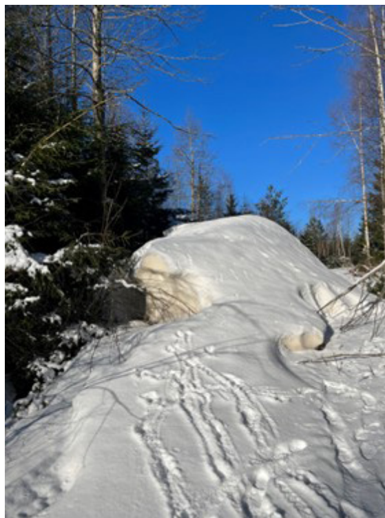
Snöhögen på BG-rundan.