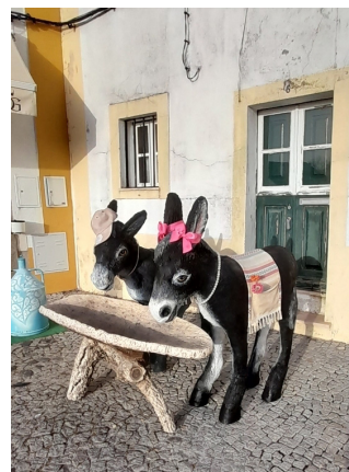
Korkåsnor vid korbord.