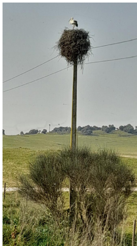
Storkbo. Påfågel vid statmur.

Frukost kl. 7.00, lite vila och kl. 10.00 avgång. Vi hade en halvtimmes resa till Torre de Colheiros där modell gick. Under resan fick vi nummerlappar och dagens karta. Terrängen var mest småkuperad med taggbuskar, stora stenar och en del mindre branter. Efter en runda i skogen åkte vi tillbaka, åt, duschade och vilade inför första tävlingsdagen.