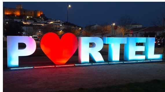
Nattorientering i staden Portel.

Den andra dagen hade vi två tävlingar. Först veckans längsta långdistans som innehöll svåra stenområden och en del jobbiga taggtrådar. Sedan på kvällen var det en nattsprint i staden Portel.