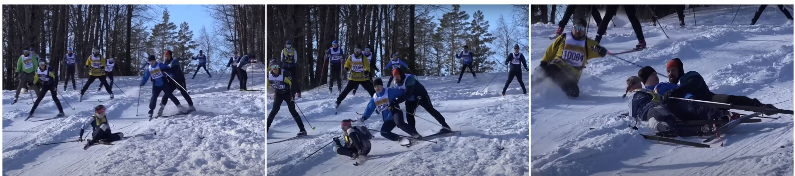
Skärmklipp från Youtube